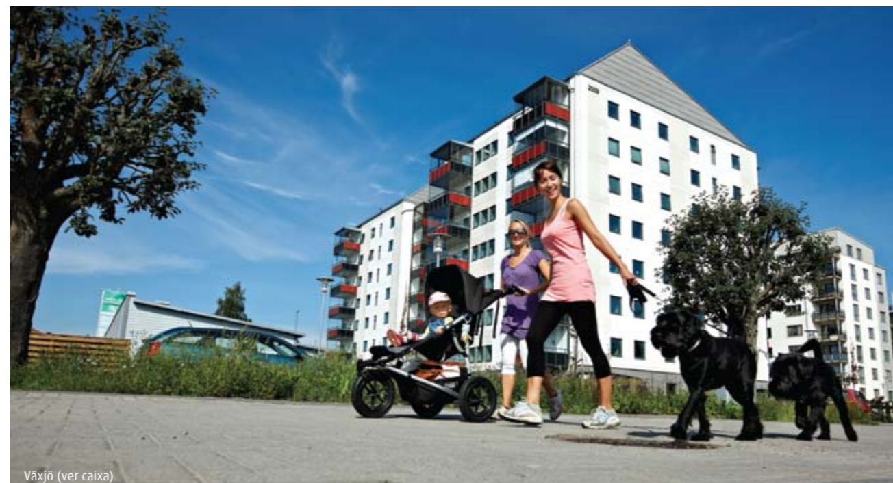
Växjö (ver caixa)